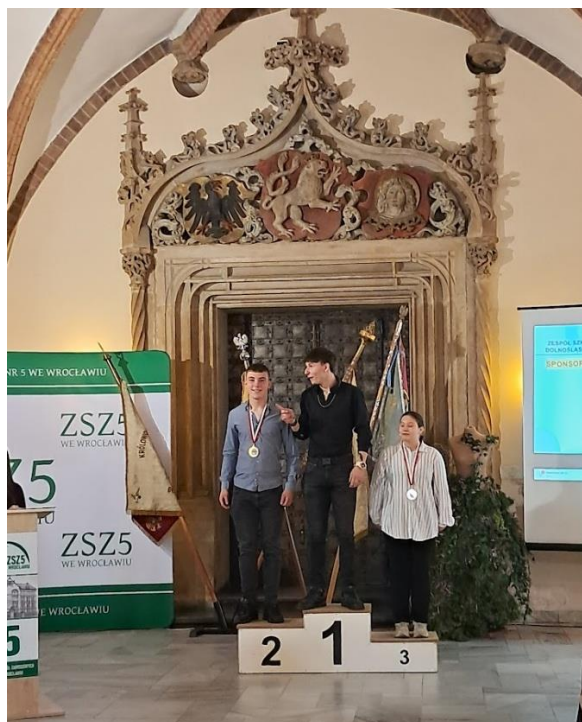
Fot. 2 Laureaci XXXI edycji Turnieju na Najlepszego Ucznia w Zawodzie Piekarz

Uczniowie na uroczystej gali, która odbywa się w sercu Wrocławia w Starym Ratuszu otrzymali medale honorowe, puchary, wiele nagród rzeczowych i pamiątek z regionu Dolnego Śląska.